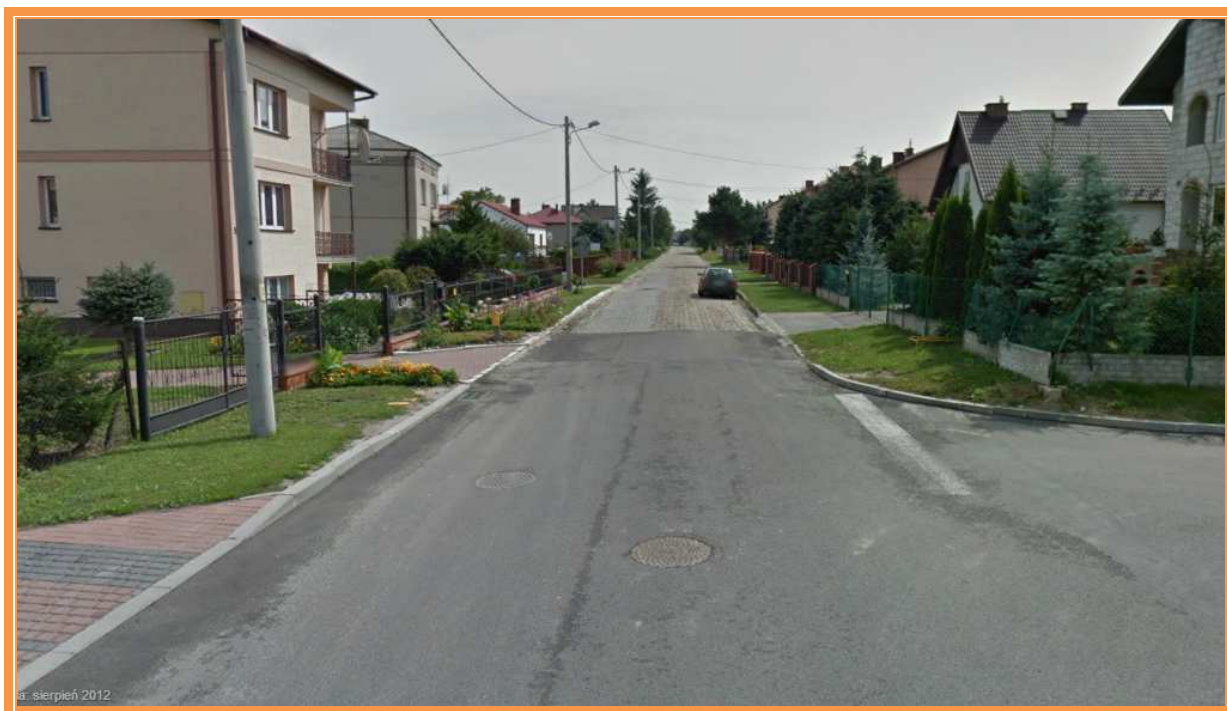
Fot. 2. Widok ul. Graniczna