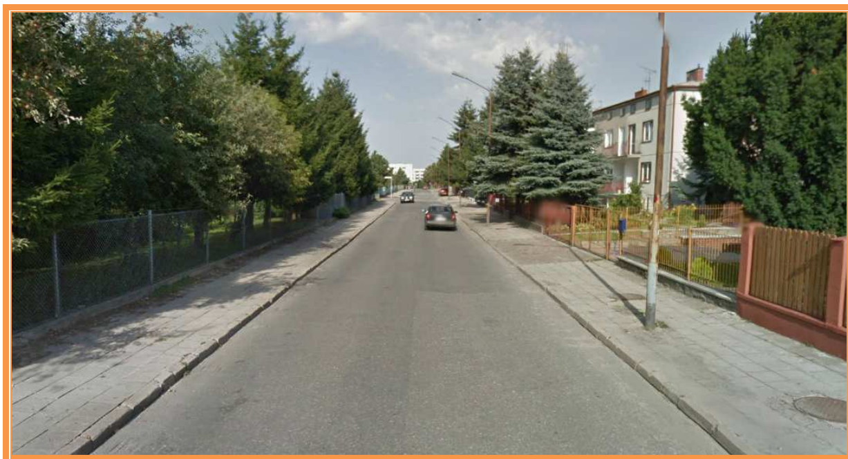
Fot. 3. Widok ul. Tokarzewskiego