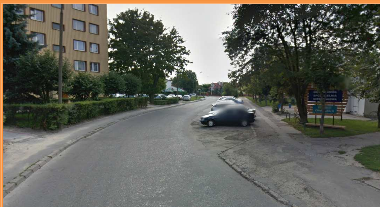
Fot. 4. Widok ul. Chmielnej

Projekt stałej organizacji ruchu na czas przebudowy ulic: Bojarczuka, Graniczna, Tokarzewskiego, Chmielna i Sobieskiego w Krasnymstawie